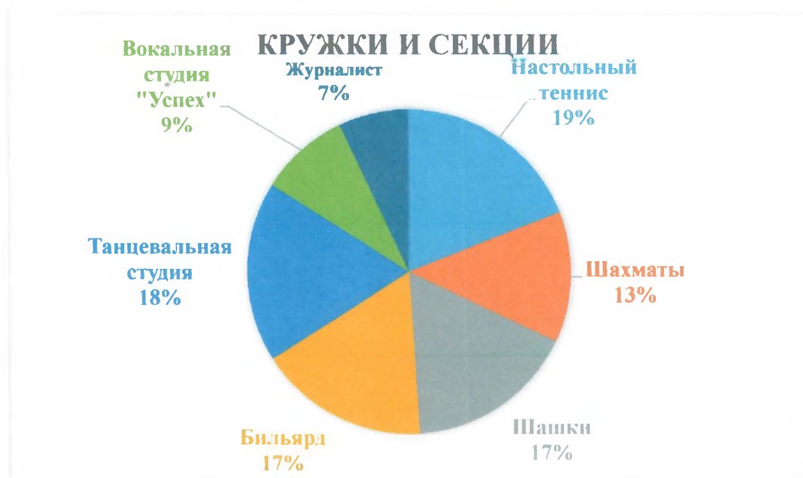
Доля обучающихся, занятых в кружках и секциях

Практическая реализация цели и задач воспитания осуществляется в рамках следующих направлений воспитательной работы Учреждения: